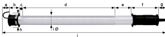
Abmessungen in mm | Dimensions in mm