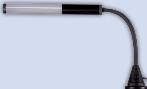
mit Magnet with magnet avec aimant met magneet