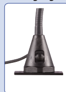
Anschraubplatte mounting plate plaque à visser aanschroefplaat