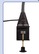
Schraubklemme screw clamp pince à visser schroefklem