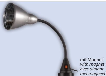
mit Magnet with magnet avec aimant met magneet

optional / optional / optionnel / optioneel